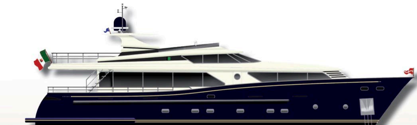
La seconda novità del cantiere è la Florioship 85'

letto a scomparsa, occupano l'intero ponte inferiore. Sul ponte superiore, raggiungibile con elegante scala interna, a poppavia della timoneria, oltre alla cabina comandante, è previsto un saloncino con tre lati completamente apribili, arredato con divani, bar ed eventuale seconda area pranzo. L'ultimo ponte è il ponte "fly", completamente votato al sole, all'aria e al contatto con il mare: sessantacinque metri quadri di spazio aperto, elegantemente